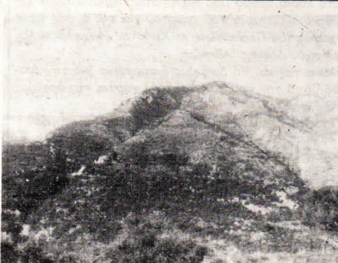
Είναι ή Καψάλα της πλαγιάς του Αγιάνη. Ας χτυπήσει ή καμπάνα για φωτιά. Προσοχή!

«Ο ΒΟΡΕΙΟΔΗΜΟΤΗΣ» ΜΗΝΙΑΙΑ ΕΦΗΜΕΡΙΔΑ ΔΙΕΥΘΗΝΤΗΣ: ΝΙΚ. Γ. ΜΕΝΙΔΗΣ ΥΠΕΥΘΥΝΟΣ ΤΥΠΟΓΡΑΦΕΙΟΥ ΜΑΡΙΑ ΜΕΝ. ΛΙΟΥΝΗ ΟΡΟΙ ΣΥΝΔΡΟΜΩΝ Έτησία έσωτερικού δρχ. 200 Έτησία έξωτερικού Η.Π.Α. — Καναδά δολ. 20 Αυστραλίας δολ. 18 Χειρόγραφα δέν επιστρέφονται