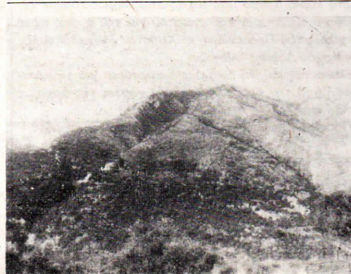
Είναι ή Καψάλα πής πηλαγιάς του Αγιάμνη. Ας μη χτυπήσει ή καμπάνα για φωτιά. Προσοχή!

«Ο ΒΟΡΕΙΟΔΗΜΟΤΗΣ» ΜΗΝΙΑΙΑ ΕΦΗΜΕΡΙΔΑ ΔΙΕΥΘΗΝΤΗΣ: ΝΙΚ. Γ. ΜΕΝΙΔΗΣ ΥΠΕΥΘΥΝΟΣ ΤΥΠΟΓΡΑΦΕΙΟΥ ΜΑΡΙΑ ΜΕΝ. ΛΙΟΥΝΗ ΟΡΟΙ ΣΥΝΔΡΟΜΩΝ Έτησία έσωτερικού δρχ. 200 Έτησία έξωτερικού Η.Π.Α. — Καναδά δολ. 20 Αυστραλίας δολ. 18 Χειρόγραφα δέν επιστρέφονται