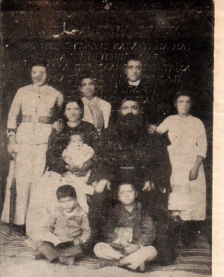
Μία οικογενειακή φωτογραφία 100 χρόνων.

Άς είναι έλαφρό το χώμα που τους σκέπασε.