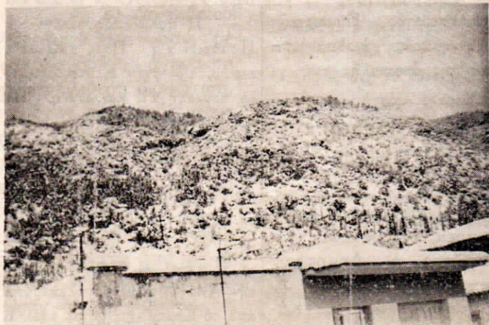
Χιονισμένα τοπία Καστορείου. "Ο Προφήτης "Ηλίας καὶ ἡ Τίκλα.