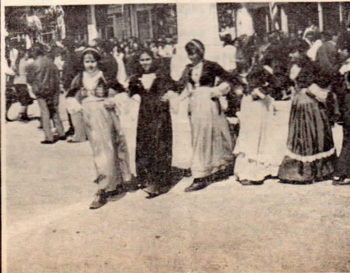
Δύο στιγμιότυπα ἀπὸ τὸν ἑορτασμὸ τῆς ἐθνικῆς ἑπετειοῦ τοῦ 1940. Οἱ μαθητὲς τῶν Σχολείων στήν παρέλαση καί στὸ χορὸ.