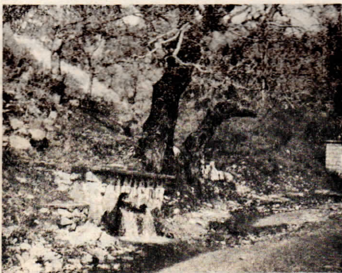
Σ' αυτή τήν πηγή τού Κάρδαρη ο Σύλλογος Βορειοδημοτών Σπάρτης, έφτιαξε θαυμάσιο έξωραϊστικό έργο.