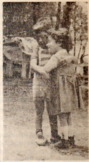
Δύο χαριτωμένα αδελφάκια παιδιά του καρδιολόγου Σωτήρη Μωυρίδη σε τρυφερό έναγκαλισμό.