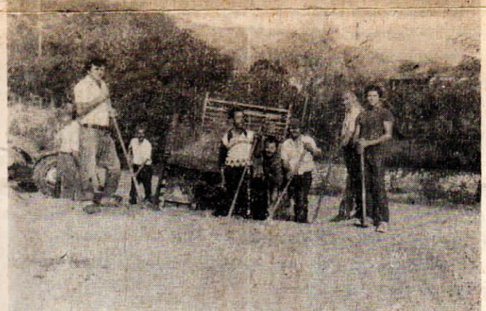
Άπό τή λαϊκή συμμετοχή στην τιμηκόστρωση των κοινοτικών δρόμων τήν τετραετία 1979-1982.