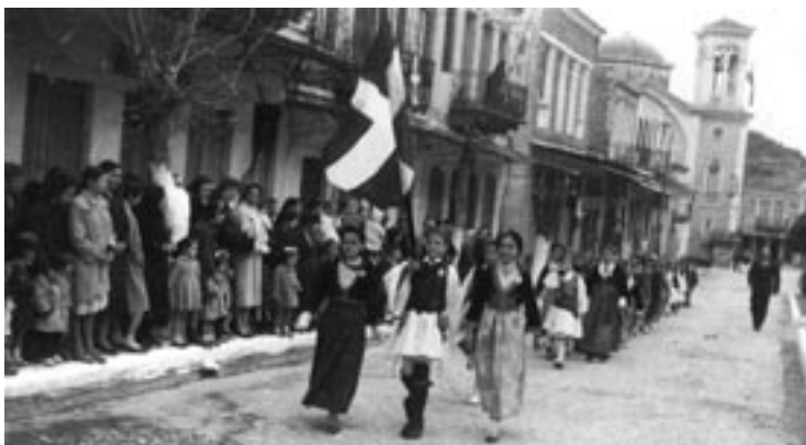
Στιγμιότυπο από παλιότερο γιορτασμό στο Καστόρι, με παρέλαση μαθητών και μαθητριών