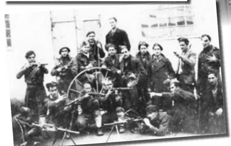
Πολλοί ήταν οι συμπατριώτες μας που πολέμησαν. Μερικοί συνέχισαν την αντίσταση και στη διάρκεια της Κατοχής.