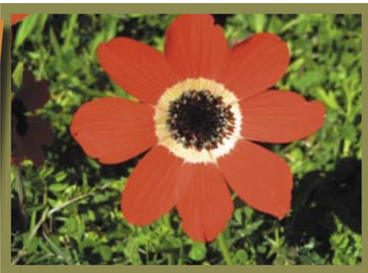
Η καστανιώτικη άνοιξη όπως φωτογραφήθηκε από το Γιώργη Λαγανά, φωτογραφία του οποίου κοσμεί και την πρώτη σελίδα.