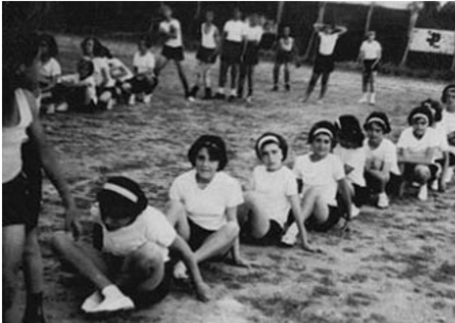
Πάνω: Στιγμιότυπο απο γυμναστικές επιδείξεις.