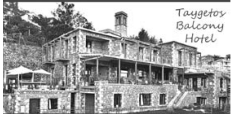
Taygetos Balcony Hotel

τηλ.: 27310 61062 fax: 27310 61063 e-mail: info@taygetosbalcony.gr www.taygetosbalcony.gr