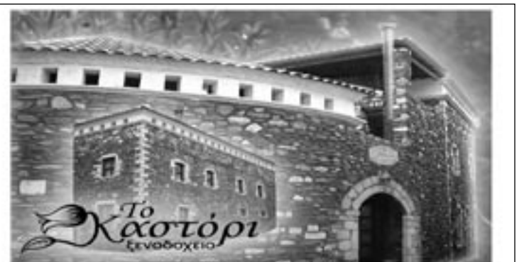
Το Καστόρι ξενοδοχείο

Ευαγγελία Νικολοπούλου Καστόρι Δόμου Πελλάνας - Λακωνία - Σπάρτη ΤΚ 23100, τηλ: 27310 57118, 6909482756, fax: 27310 57205 www.kastorihotel.com - www.focusgreece.gr email: info@kastorihotel.com